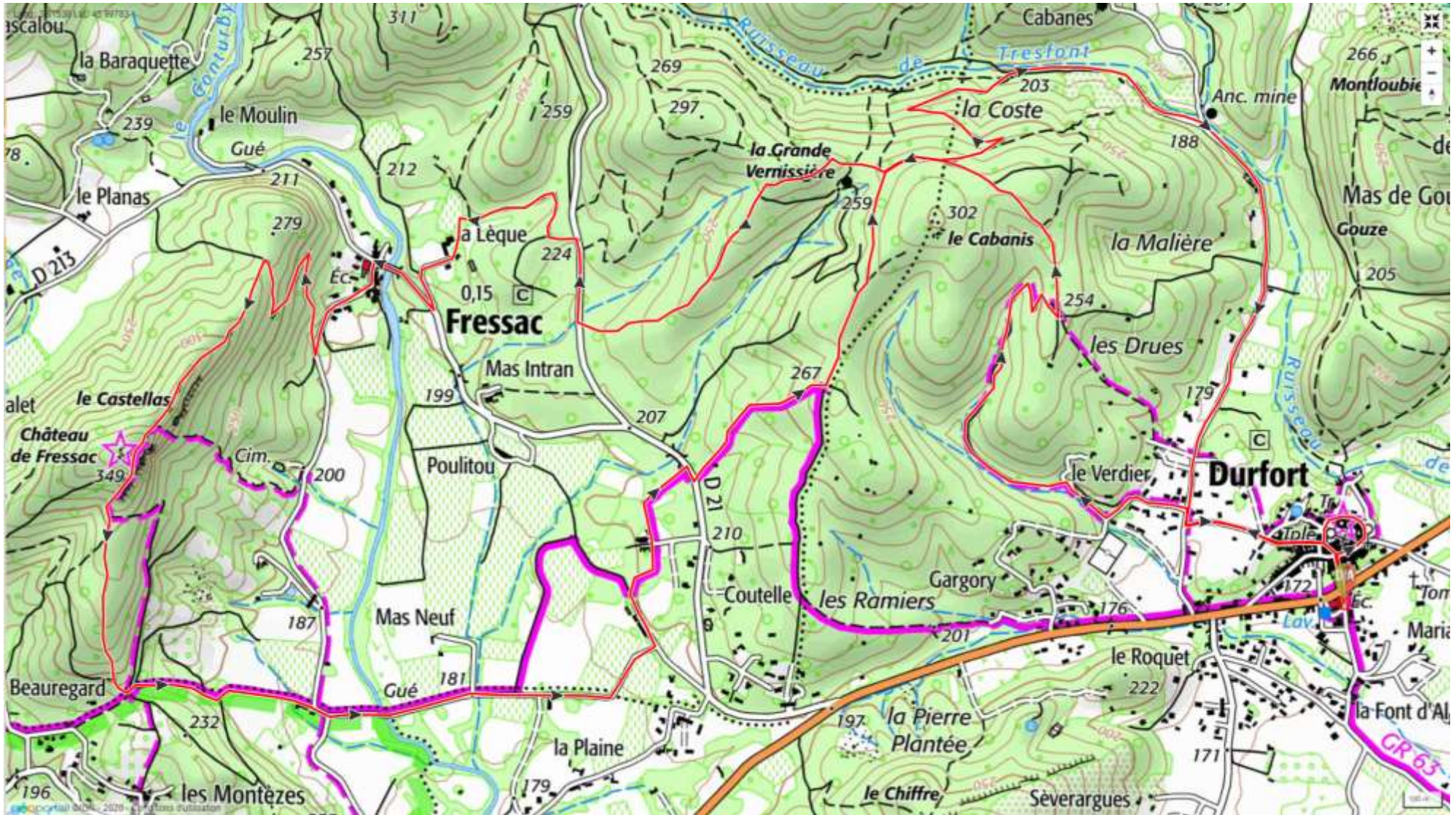
Randonnée "Durfort – Château de Fressac" (++, 13,2 km, 350 m)