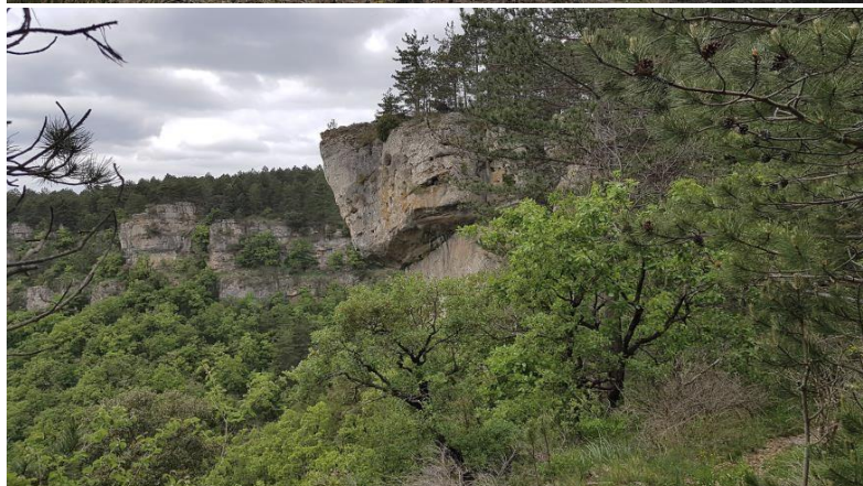
Arche, quille et le pas de l'Aze