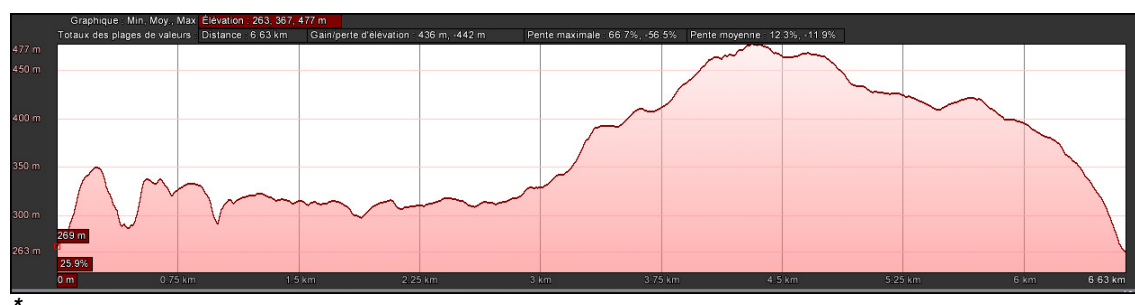
Profil de la randonnée Taurac

Retour classique par le « Pas du Posol »