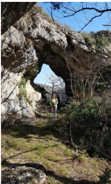
Une autre arche naturelle