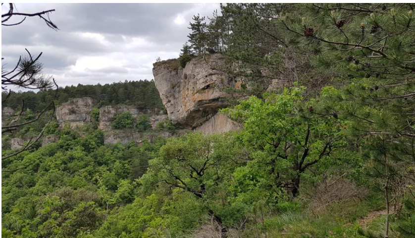
Le pas de l'Aze.

On quitte le bord du plateau et on rejoint un large chemin. On quitte quelques instants ce chemin (aller-retour) pour voir le pas de l'Aze et le départ du chemin vers Saint-Privas. On arrive ensuite aux remarquables arches de Fontanille. Retour en descendant le pas de l'Aze vers le village de Saint-Privas et remontée par l'ancien chemin de Saint Privas à La Vacquerie. Par de larges chemins, on rejoint le Col du Vent. (petit trafic de voitures à prévoir le matin).