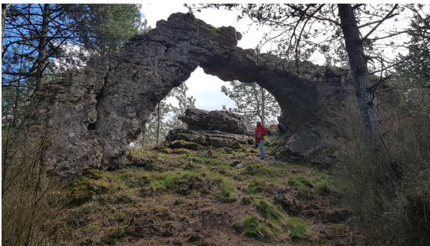
La première des cinq arches de Fontanille.