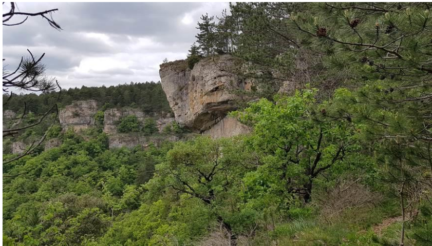
Le pas de l'Aze.

On quitte le bord du plateau et on rejoint un large chemin. On quitte quelques instants ce chemin (aller-retour) pour voir le pas de l'Aze et le départ du chemin vers Saint-Privas. On arrive ensuite aux remarquables arches de Fontanille. Retour : par de larges chemins, on rejoint le Col du Vent. (petit trafic de voitures à prévoir le matin).