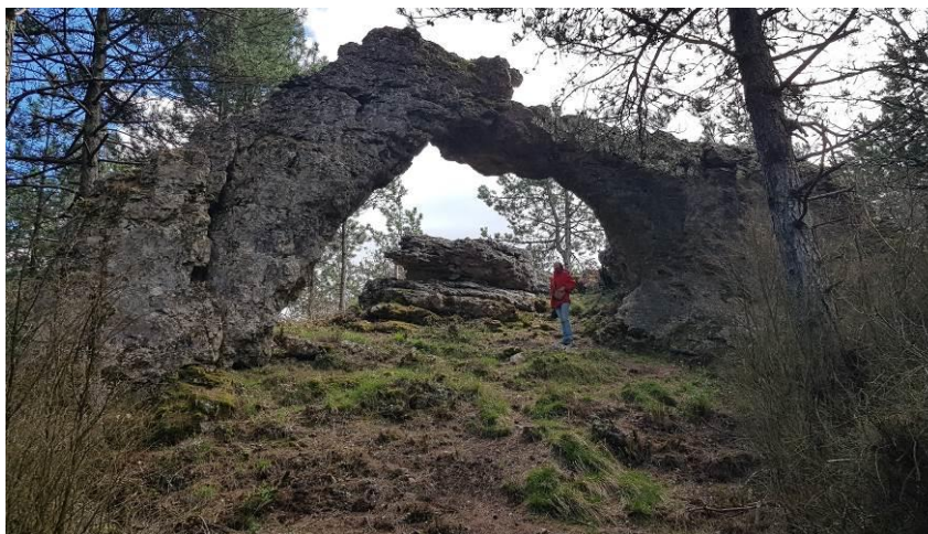
La première des cinq arches de Fontanille.