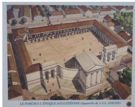
Le forum de l'oppidum de Murviel-les-Montpellier.