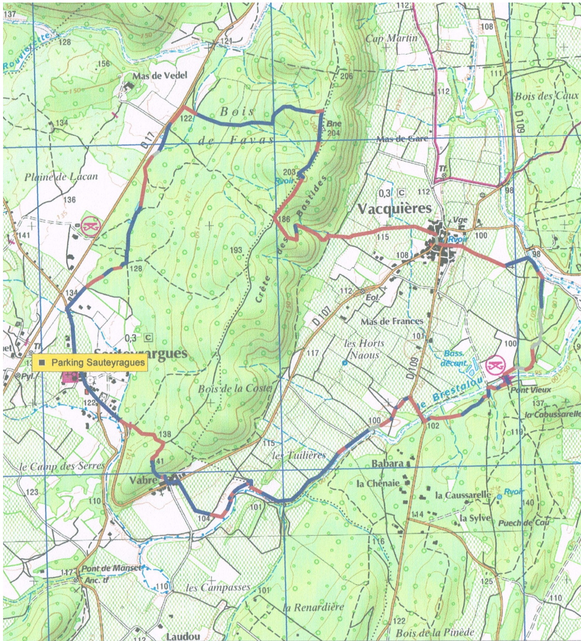
Projection Lambert II étendu / NTF - Grille Lat/Long / WGS84 Données GRP®, GRP®, PR®