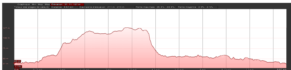
Profil de la Randonnée

Nous traversons la Mosson pour trouver la station thermale de Fontcaude et remonter au parking.