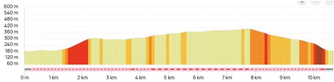
Profil de la randonnée