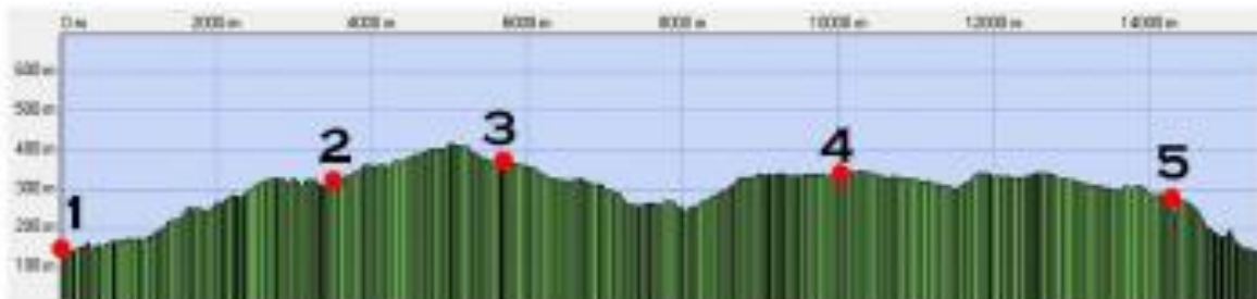
Dénivelé des mazets de garde de Coutach

La randonnée s'effectue dans un massif forestier de basse altitude, au nord du village de Corconne, Elle débute par la traversée du Bois des Costes. Après être passé près d'une citerne de lutte contre l'incendie, le cheminement se poursuit entre le Serre de la Civade et le Serre du Grand Cressau pour rejoindre le mazet de garde de Sauve (mazet, puits, géocache). Par le chemin de la Combe de la Vache Morte, nous rejoindrons le grand chemin de Sauve à Corconne. Par les Devèzes, remontée vers le Serre de l'Esquille et le Plan de l'Etoile jusqu'aux Trois Termes pour parvenir au mazet de garde de Corconne (mazet, puits). De retour sur le chemin de Sauve à Corconne, nous bifurquerons sur le sentier du Castellat, avec un petit détour au Pont du Hazard avant de poursuivre jusqu'aux ruines du castellas et sa chapelle attenante. Poursuite de la descente jusqu'au village de Corconne et la Coopérative.