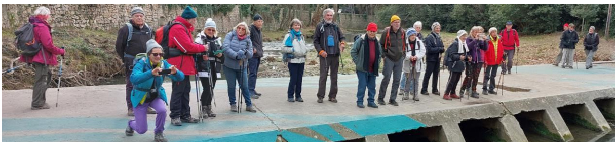
Pont sur la Mosson. En attendant la montée des eaux ?