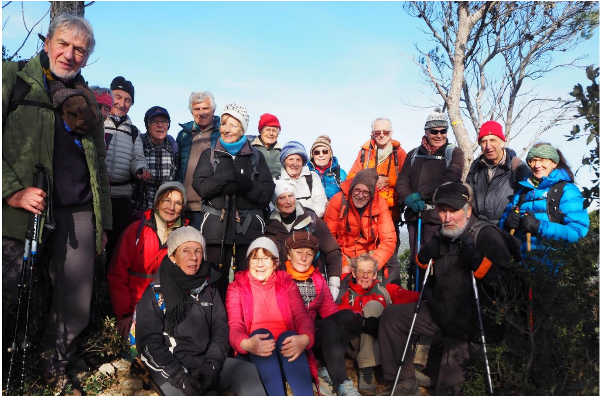
Les randonnées hebdomadaires en période hivernale ↑ et estivale ↓.