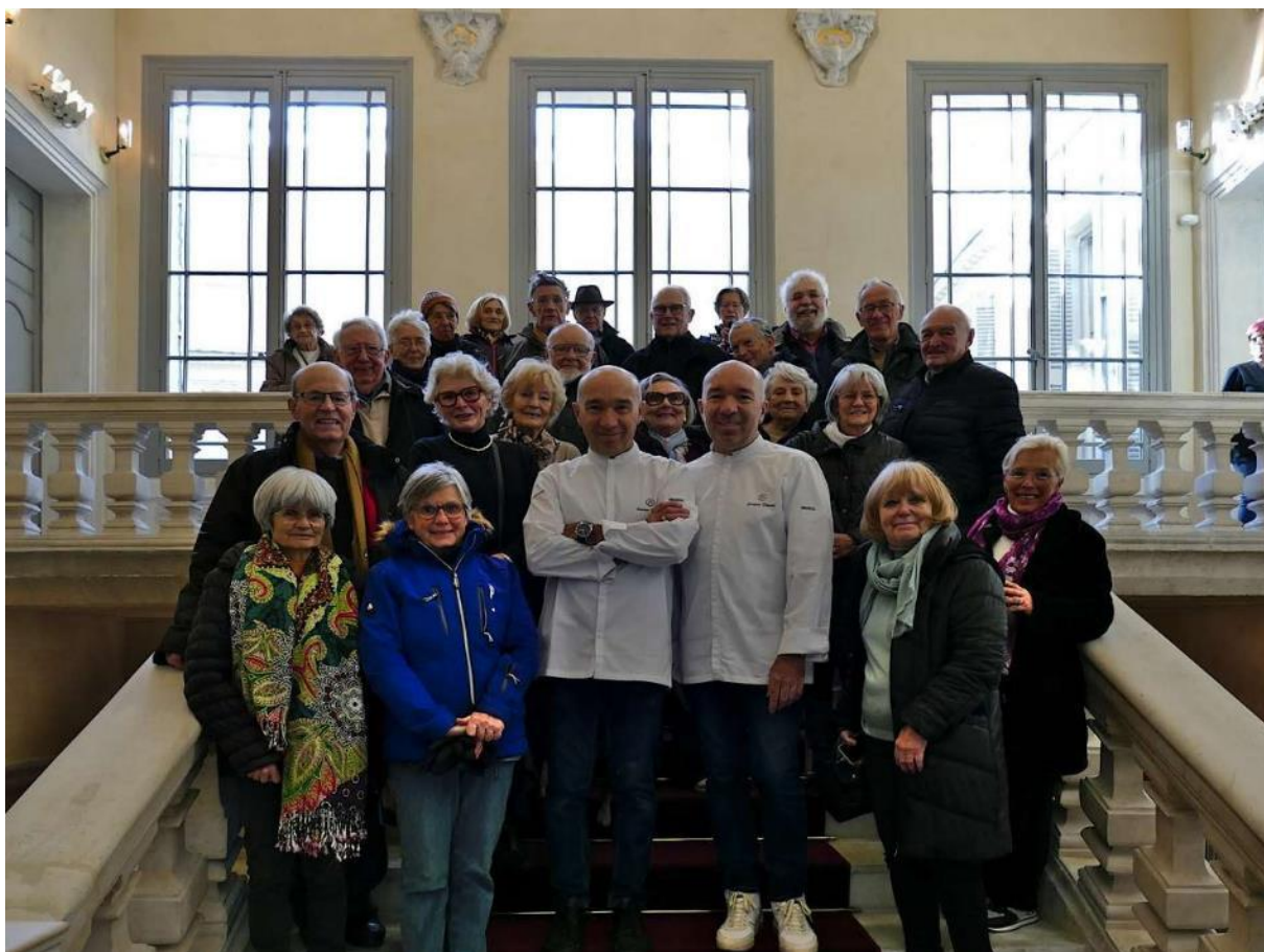
Oui nous étions au Jardin des Sens ... pour visiter !