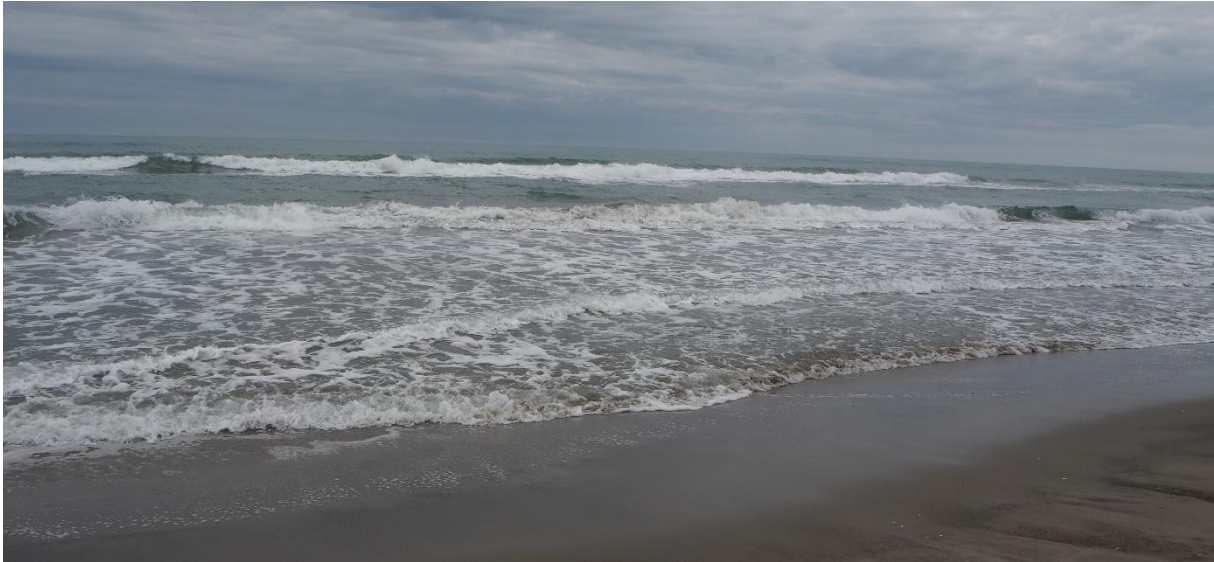
De la Digue à la Mer

Bien que nous disposions d'une boîte postale sur le site de Triolet, il est toujours demandé de faire parvenir les chèques à l'adresse, indiquée, de la personne responsable de l'activité.