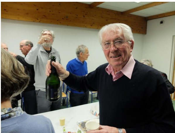
A la bonne vôtre !