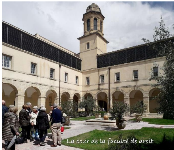
La cour de la faculté de droit