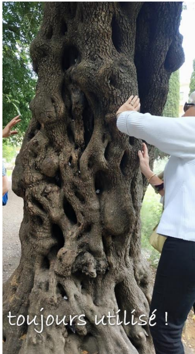
L'arbre aux messages du Jardin des Plantes.