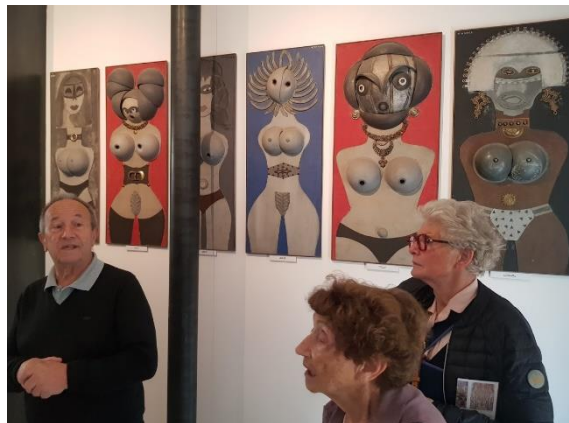
"Musée de l'art brut"