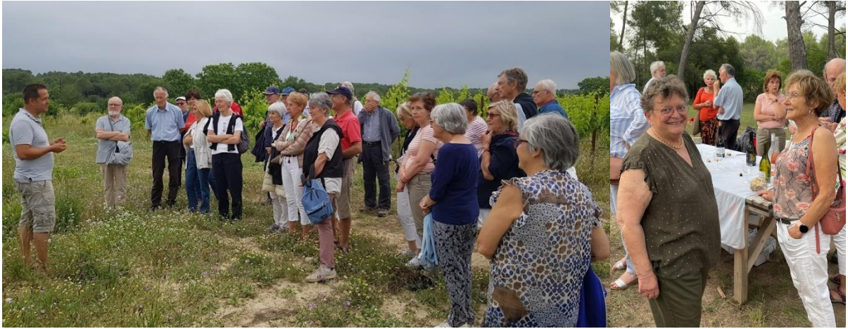
Fête d'été au Mas de Bannières.