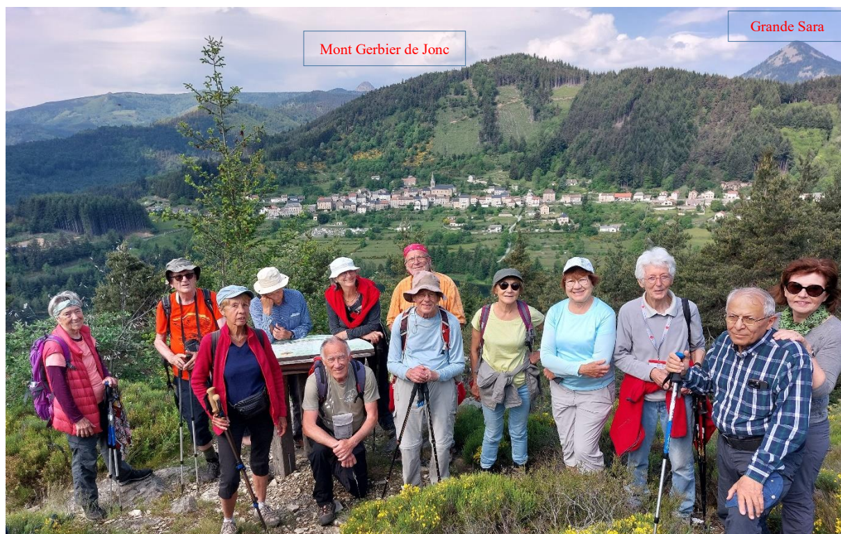
Sur le suc de Lestrat, au-dessus du lac de Saint-Martial.