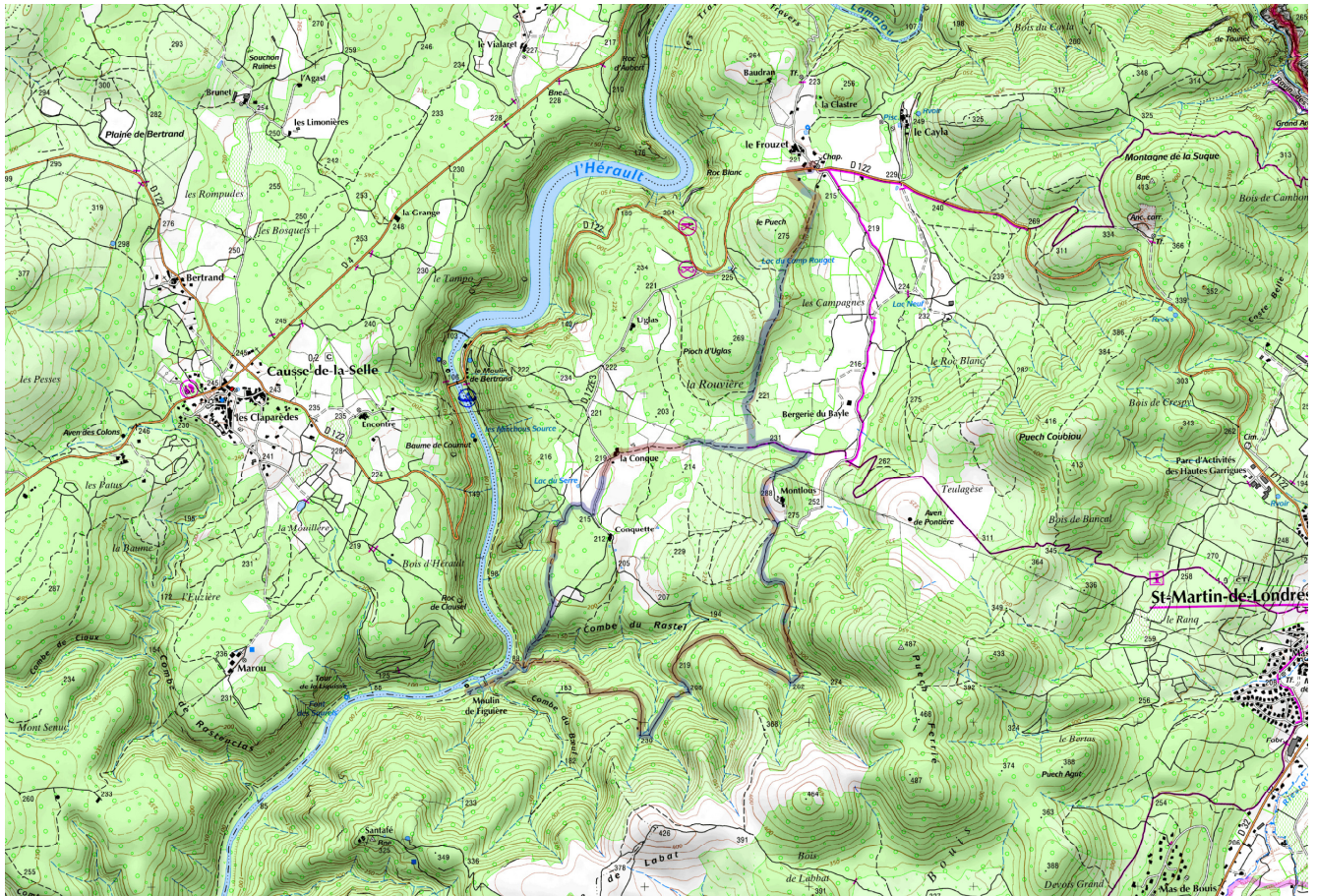
Carte IGN de la randonnée Le Frouzet - Moulin de Figuière