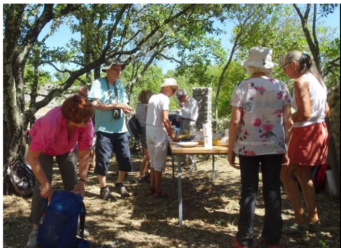
30 juin 2020 à Roquevaire (Sauve)