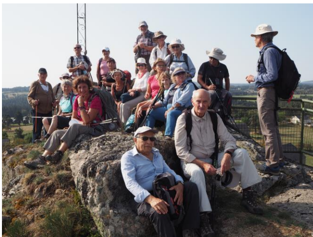
16 septembre 2020 sur le Rocher du Cher