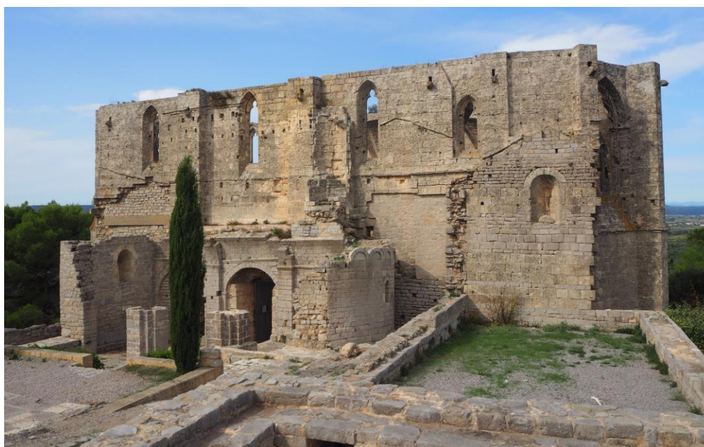
29 septembre 2020 Saint-Félix de Montceau